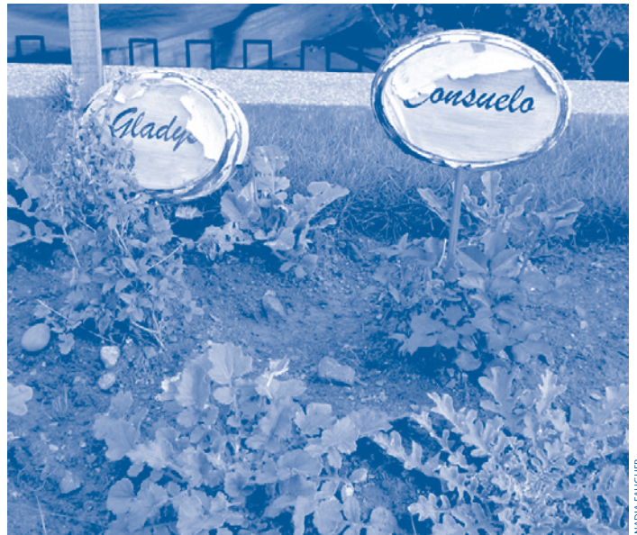
Jardin commémorant les femmes survivantes de violences sexuelles, Huancavelica, Pérou.

Au Pérou, lorsque DEMUS a commencé à offrir un accompagnement juridique et psychosocial aux femmes autochtones victimes de violences sexuelles, force a été de reconnaître les limites des approches occidentales auxquelles les membres de l'organisation avaient été formés. De fait, de nombreuses communautés andines ne connaissent pas la notion de santé mentale, mais reconnaissent la santé comme condition physique et sociale. Pour expliquer ce qui manquait à leur vie, les femmes de la communauté de Manta parlaient d' allin kausay , une expression quechua qui se traduirait par « bien vivre ». Allin kausay représente l'équilibre entre un ensemble d'éléments, pensées, émotions, travail, nature, divinités et autres. L'allin