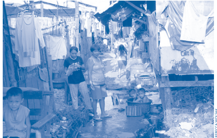
Une des rues de Paradise, Manille.

Nous parvenons enfin à la minuscule clinique et faisons le tour des quatre pièces d'où sont offerts les services de santé génésique. À l'étage, dans la salle d'attente, quelques dizaines d'ouvrages usagés récemment acquis s'alignent sur les étagères. La nouvelle « bibliothèque » de la clinique est un espace sécuritaire et accueillant pour les jeunes qui viennent y faire un saut, y organisent des rencontres sociales ou y discutent de questions taboues comme le sexe.